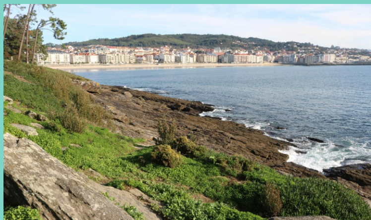
Punta Vicaño, con Sanxenxo ao fondo