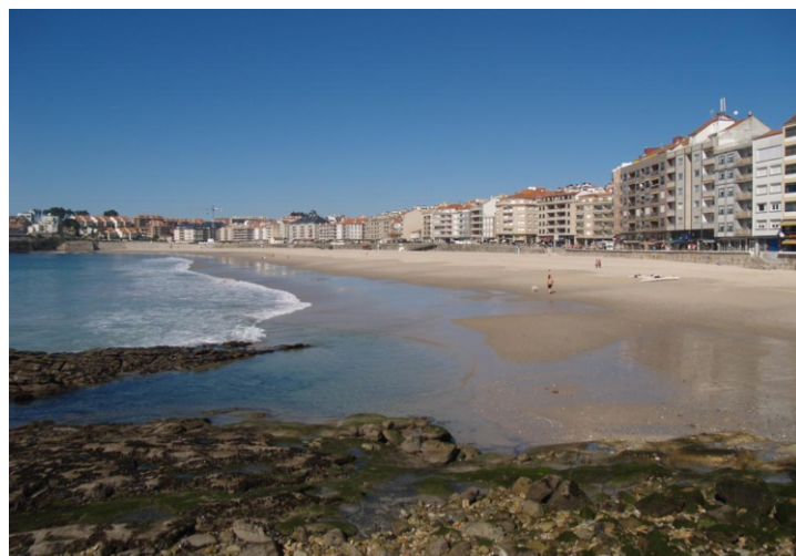
Praia de Silgar. Areal urbano de 750 m de lonxitude.