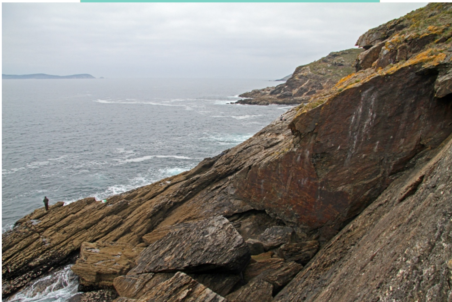
Punta Cabicastro, límite norte da ría de Pontevedra. Desde ela hai vistas sobre a ría, O Morrazo, arquipélagos de Ons e Cíes e costa ata punta Faxilda.

É a máis pequena das rías baixas e ábrese, seguindo unha fractura con dirección SO-NE, entre as puntas de Cabicastro, ao norte e o cabo Udra, ao Sur.