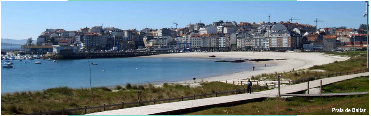
Praia de Baltar