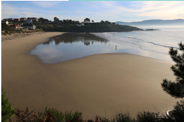
Praia de Canelas