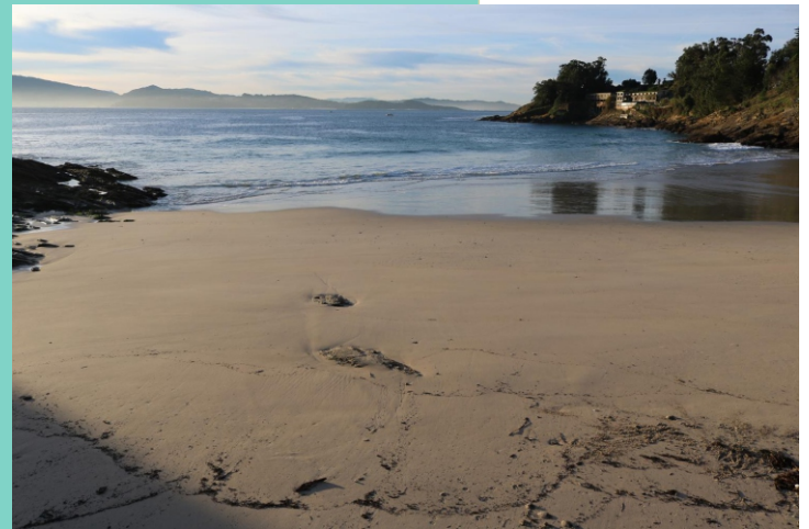
Praia e enseada de Caneliñas