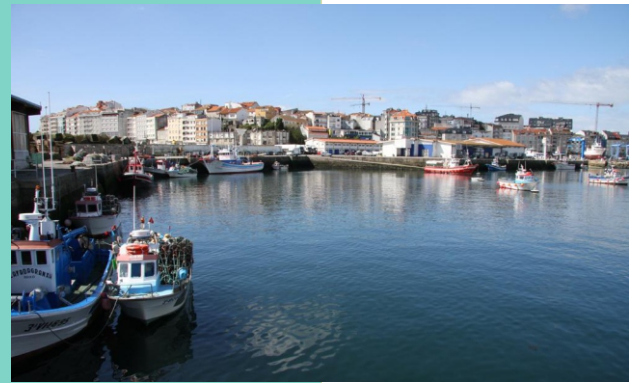
PORTONOVO, o principal porto pesqueiro de Sanxenxo.