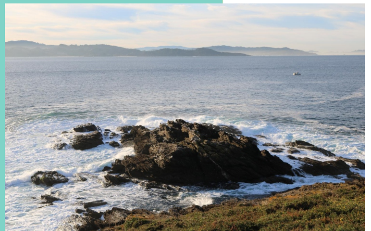
Punta Seame e Illote Papatimóns.