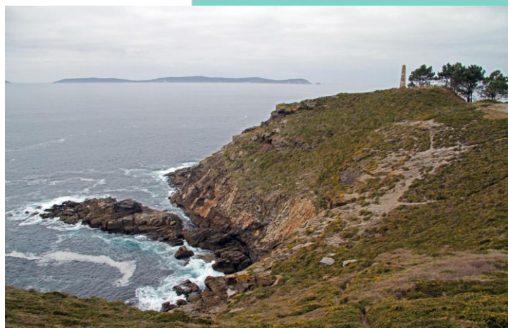
Punta do Elmo